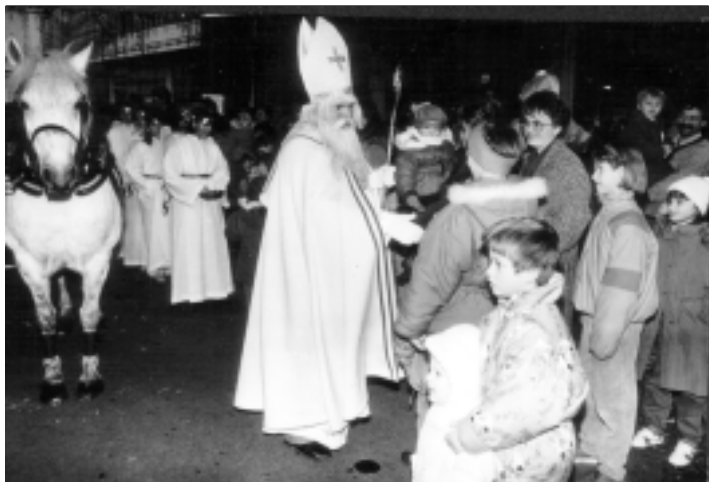
Miklavž ima rad otroke in se mednje vsako leto pripelje na vozu. (Miklavževanje v Kamniku decembra 1994).

Dva dni kasneje, 6. decembra, praznuje verjetno najbolj priljubljen svetnik v celotnem koledarskem letu – sv. Nikolaj, med otroci veliko bolj poznan kot sv. Miklavž . Zgodba pravi, da naj bi bil v 3. stoletju škof v Miri v Mali Aziji, znan po svoji nesebičnosti in dobroti do soljudi. O tem priča legenda, ko naj bi tri hčere siromašnega moža rešil sramote ob poroki. Oče namreč ni imel denarja, da bi jim dal doto, zato je ponoči sv. Nikolaj naskrivaj vsaki od hčera podtaknil kepo zlata. Od tedaj verjetno tudi izhaja šega, da Miklavž nosi predvsem ponoči in da