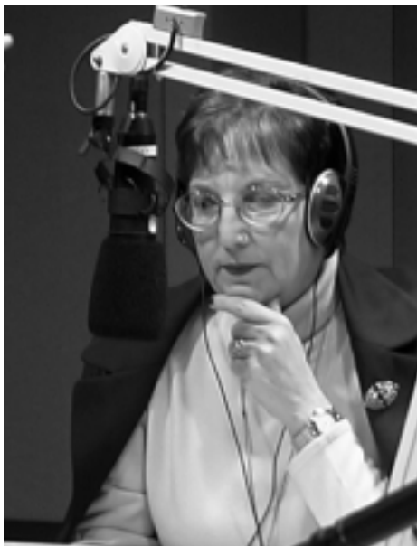
"Radio SBS, oddaja v slovenskem jeziku ... "

V imenu Sina, žrtve ranjene Ljubezni, sem ti še zaživa ubesedila svoj vpogled v tvoja široka zorišča: