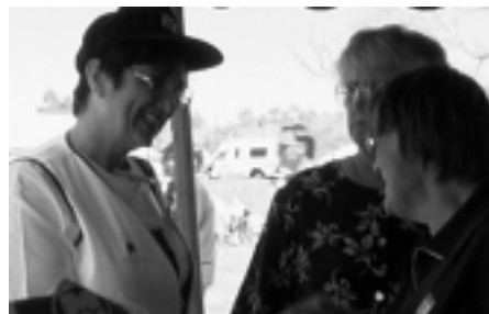
Jindabayn: "Kakšno prijetno srečanje ob 50-letnici Snowyja ... "