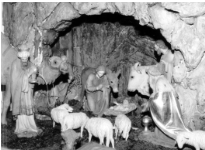
Jaslice so kristjanom v pomoč za boljše razumevanje dogodkov Jezusovega rojstva (cerkvene jaslice, slikano na razstavi jasic v Kamniku leta 1995)

Sicer pa adventni čas obsega štiri nedelje, včasih pa jih je bilo celo pet. Spominjal naj bi na štiri tisočletja od Adama do Kristusa. Advent je tudi čas zunanje priprave na Božič. Tako so moški v večerih izdelovali jaslice. Sprva so jih izdelovali iz lesa, potem pa je razširitev papirja izpodrinila to obrt. Spodobi se in stara navada je, da se za velike praznike v hiši in okoli nje vse počisti.