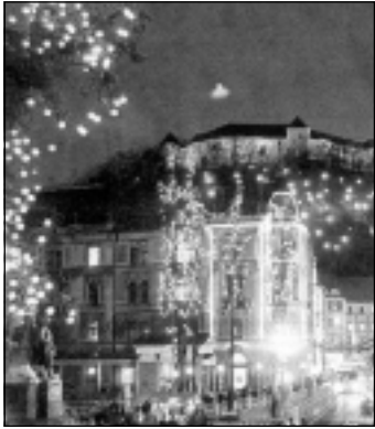
Božično-novoletno razsvetljena Ljubljana