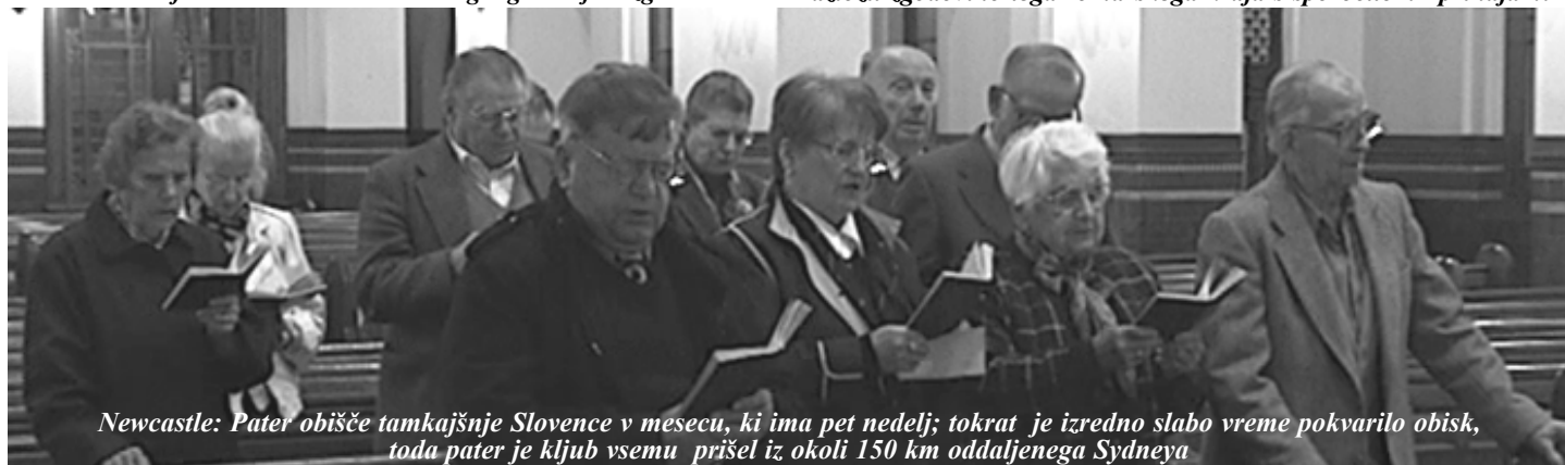
Newcastle: Pater obiše tamkajšnje Slovence v mesecu, ki ima pet nedelj; tokrat je izredno slabo vreme pokvarilo obisk, toda pater je kljub vsemu prišel iz okoli 150 km oddaljenega Sydneya