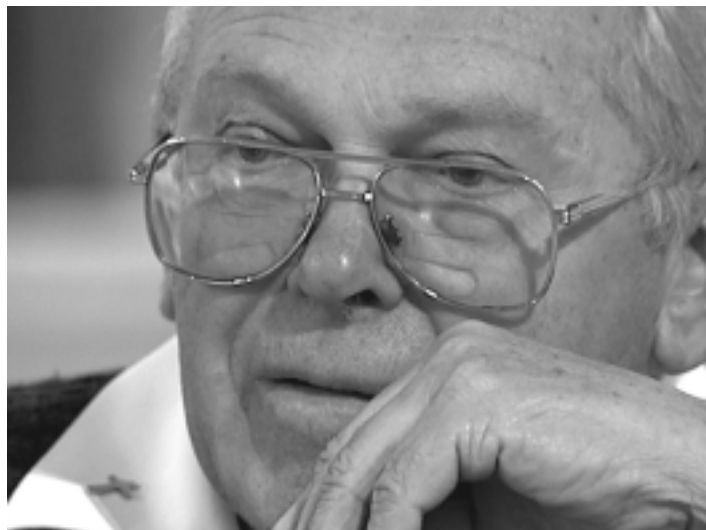
Patrova skrb za skupnost se večkrat odraži tudi na njegovem obrazu