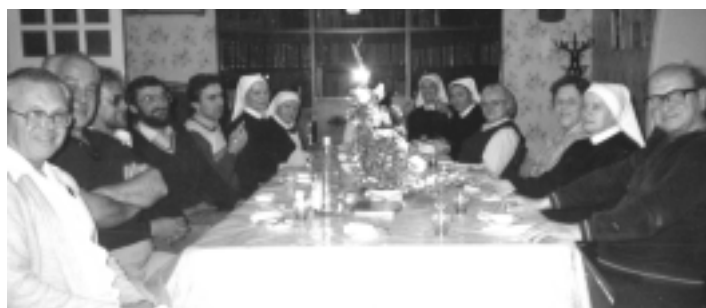
Lepo je bilo pogledati tako veliko skupino slovenskih sester in frančiškanov, ki so dolga leta vestno skrbeli za svoje slovenske rojake