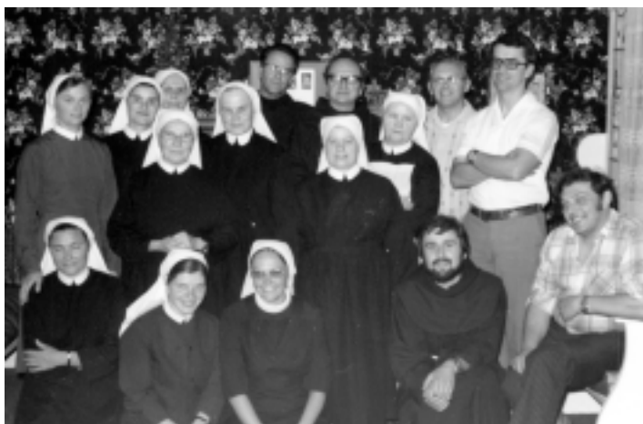
Včasih je bilo v Avstraliji veliko slovenskih sester, že nekaj let je odkar smo ostali brez njih ...