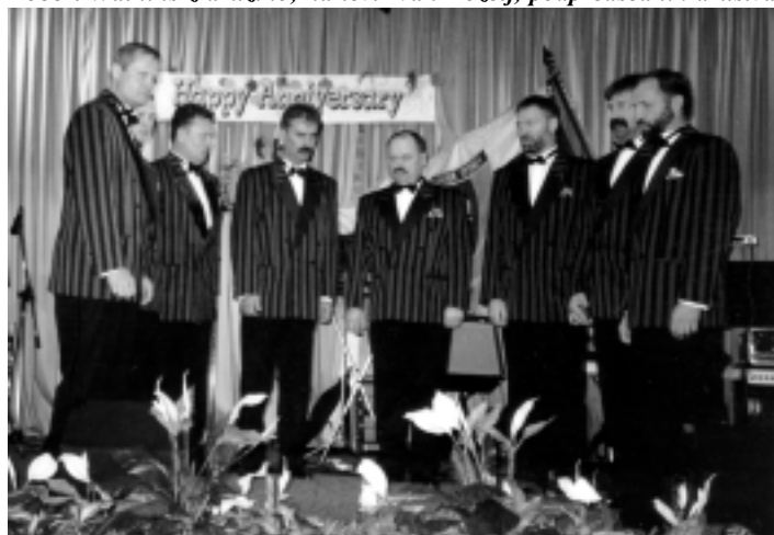
Oktet Deseti brat iz Slovenije, na proslavi ob 10-letnici slovenske države v Slovenskem društvu Sydney