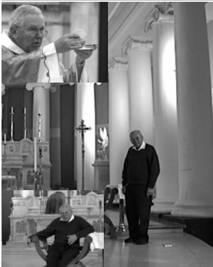
Cerkev v Paddingtonu: Tukaj se je leta 1963 začela patrova avstralska pot ...