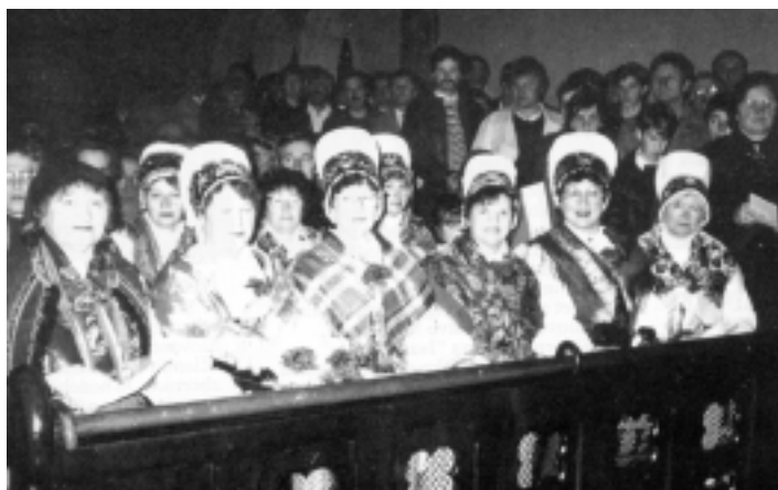
Melbourne, 1991 – Katedrala St. Patrik, maša za mir

16.6. se v pisarni slovenskega podjetja Eurointernational v Melbournu srečajo predstavniki slovenskih društev in organizacij s pomočnikom sekretarja ministra za zunanje